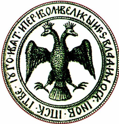
Рис. 1. Именная печать Ивана III

В середине XVII века неизвестный книжник, пересказывая одну из легенд об основании Москвы, не мог скрыть удивления перед загадочной судьбой этого города. «Кто же думал, что Москве первой быти, и кто же знал, что Москве государством слыти?» — недоуменно спрашивал он.