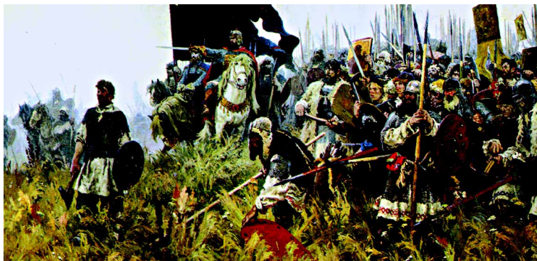
Рис. 2. Утро на Куликовом поле. Худ. А. Бубнов

ломатов, ведь западные государи начали искать дружбы сильного московского князя, пытались заключить с ним торговые и политические соглашения.