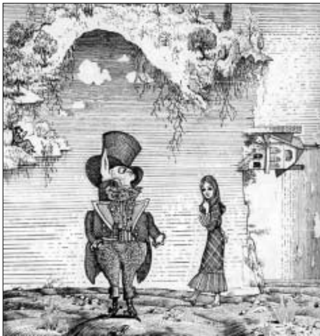
Кролик и Алиса. Худ. Г. Калиновский

2. Разминка: «Откуда я знаю, что я думаю? Вот скажу, тогда узнаю!» — помните, так говорила Алиса. Сейчас мы узнаем, что вы думаете и как знаете содержание сказки.