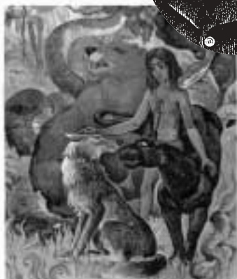
Р. КИПЛИНГ · МАУГЛИ