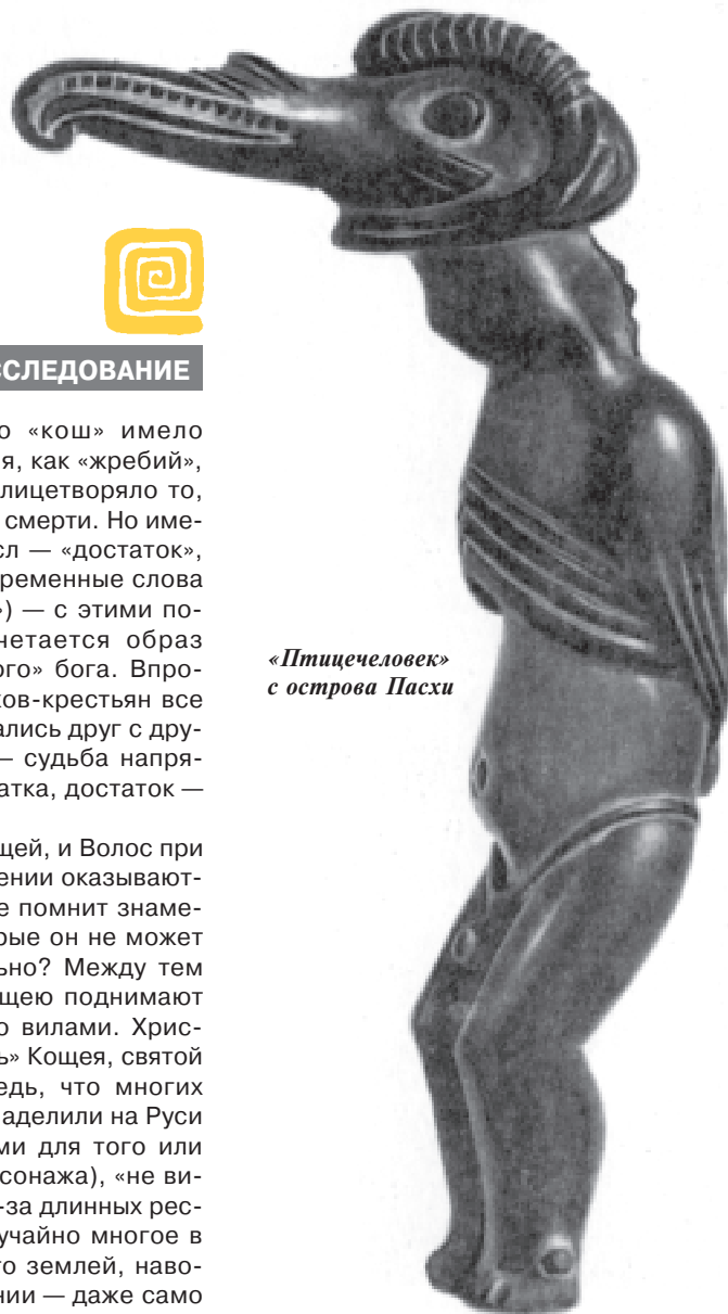
«Птичеловек» с острова Пасхи

север: «И плы из света во кошное, сиречь во тьму кромешную».