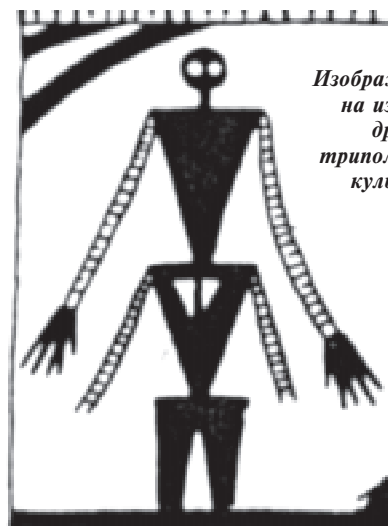
Изображение на изделии древней трипольской культуры

Может, сказки о Кошее — отголоски подобных ритуалов? Чтобы сместить старого, закосневшего правителя, надо было опередить его в поисках яйца. Самый простой и, пожалуй, исходный вариант знакомого нам с детства описания «условий соревнования» звучит так: «На этой горе стоит дуб, на этом дубу есь гнездо, в этом гнезде есь Кошшея Бессмертна яйцо...» Уж не предполагали ли наши предки, что Кощей откладывает яйца и хранит их в далеком гнезде?