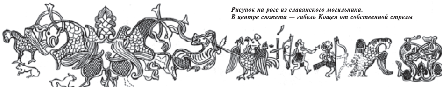
Рисунок на роге из славянского могильника. В центре сюжета — гибель Кощея от собственной стрелы

века, которого считали воплощением бога плодородия. Иногда все решал поединок. К примеру, каждый год самый сильный воин Гавайских островов метал копье в царя, который должен был поймать его рукой. В других странах решающую роль играли жалобы жен: сдает, мол, повелитель... Как тут не вспомнить недовольство пленницы царя Кощея, которая находит в итоге уязвимое место своего повелителя и рассказывает молодому и пригожему избавителю про яйцо, несущее Кощею смерть?