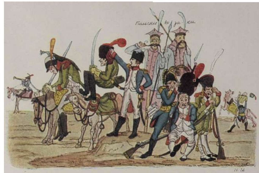
"Наполеон формирует новую армию из роты уродов и калек".