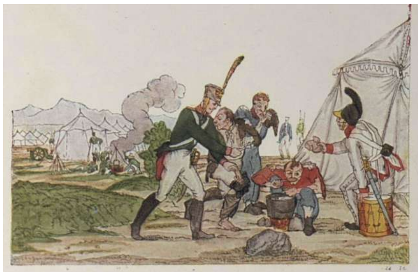
"Хлебосольево — отличительная черта в характере народа русского". ("С. Ом." 1813 г. № 6.)