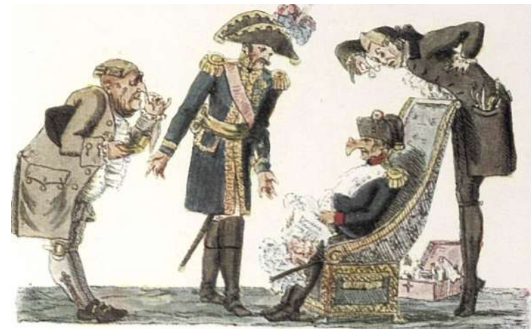
"Нос, привезенный Наполеоном с собой из России в Париж".

Наполеон: Вот какой нос приставили мне русские! Не знаю, как мне с ним показаться парижской публике! Нет ли средств укоротить его?