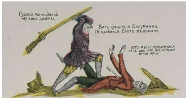
(Первая лубочная картинка.)