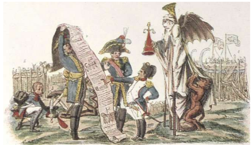
"Наполеон занимается проектами снарядов для будущей кампании"