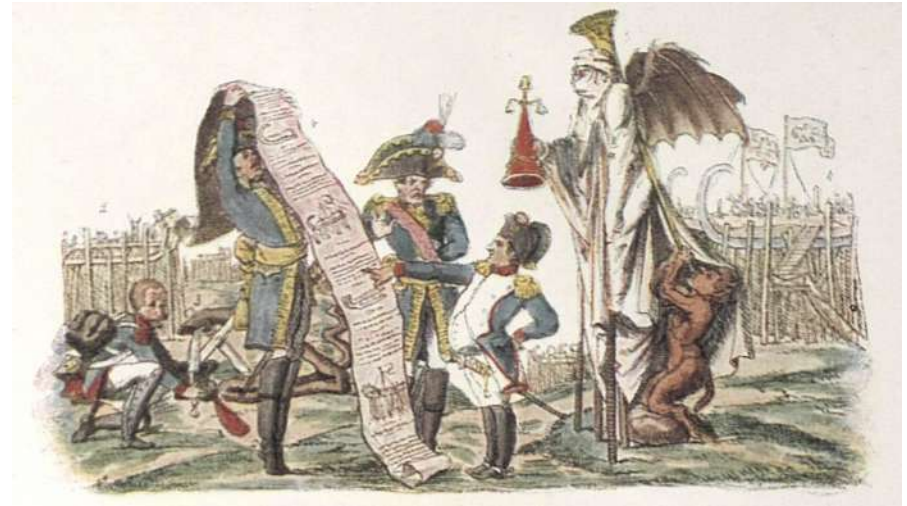
"Наполеон занимается прожектми снарядов для будущей кампании"