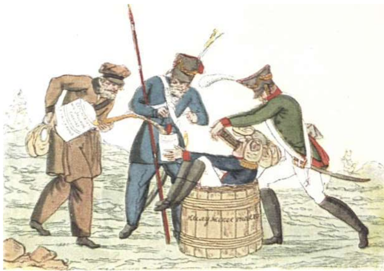
Угощение Наполеона в России. "Свое добро тебе приелось! Гостинцев русских захотелось?! Вот сласти русские, поешь — не подавись! Вот с перцем сбитенек, попей — не обожгись!"