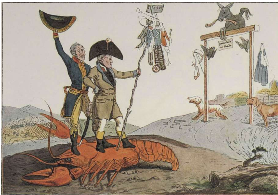
Триумфальное прибытие в Париж Наполеона.