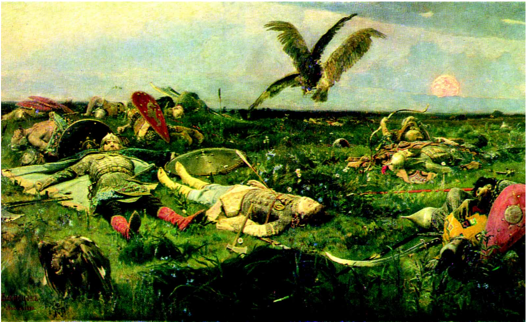
Рис. 2. После побоища Игоря Святославича с половцами. Худ. В. Васнецов

хотные ростки грядущего возрождения. Это сложная, но важная и интересная задача.