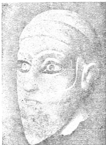
Голова алебастровой статуи семита из Адаба.

Саргон начинает с самого трудного, с завоевания Шумера. Вот он появляется неожиданно под стенами Урука, где засел Лугальзаггиси. Хорошо укреплен старый город, но войско Саргона внезапным приступом