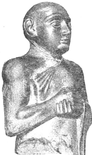
Статуя шумерийца. (Гудеа в юности.)

в части современной Палестины, т. е. в гористой стране по восточному берегу Средиземного моря. Плодородны долины в этих горах, много дичи водится в них, но могут ли они прокормить большое население? Конечно нет. А Евфрат, поворачивая от гор Тавра излучиной на юго-восток, подходит так близко к этим долинам, так обильны рыбой его воды, такие цветистые пастбища расстилаются по его берегам весной, что амореи, — амурру, как их называли в Двуречи, — постоянно переходили из своих долин на берега Евфрата и обратно, постепенно становясь оседлыми. Недавно ученые нашли и разобрали древнюю надпись, описывающую живо этот момент перехода горцев-семитов к оседлости: