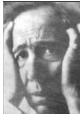
Последняя фотография А. Беляева. В его глазах — отчаяние и боль

квартире, так как у родных не было возможности его похоронить. Мы можем только предположить, как пролегал последний путь А. Беляева по улицам города. От дома писателя на Коношенной, д. 19, по Садовой улице, затем по Парковой улице до Софийского собора и по Гусарской (Огородной) и Саперной улицам до Казанского кладбища. В списке захоронений могила писателя — под № 13. Верующие люди могут поставить свечку в Софийском соборе либо в Казанской часовне на территории кладбища.