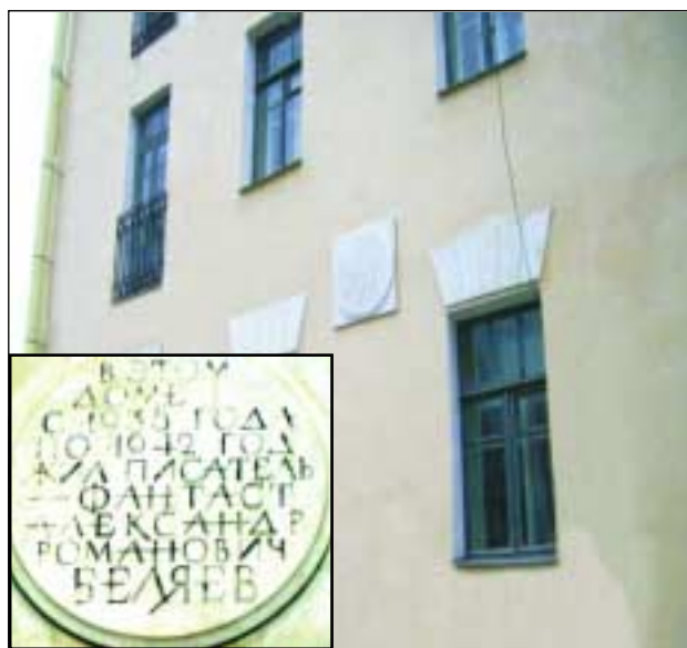
На доме № 19 по Конюшенной улице мы увидели мемориальную доску

А. Беляев проживал на третьем этаже четырехэтажного дома по улице Конюшенной, дом № 19, во дворе которого находился кинотеатр «Авангард». Во время Великой Отечественной войны дом был разрушен, на его месте стоит новый трехэтажный дом. Квартира, в которой проживала семья А. Беляева, состояла из шести не-