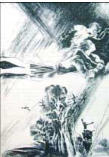
Иллюстрации к произведениям А. Беяева

гивается весьма близкая для меня медицинская тема: вмешательство в человеческую сущность. Но главное, чтобы наука приносила пользу людям. Профессор Сальватор не сделал Иктиандра счастливее, судьба профессора Дуэля трагична. Автор мечтал о том, что наука достигнет таких результатов, когда мысль человека продолжает работать, а тело уже погибло.