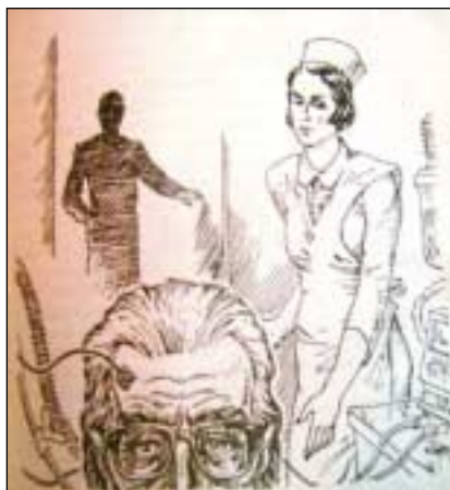
Иллюстрация к произведению А. Беляева «Голова профессора Доуэля»