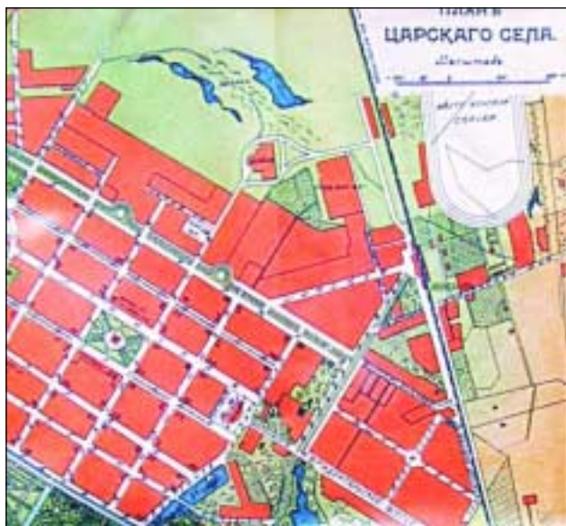
Карта Царского Села

По собственному опыту я знаю, что значит лежать неподвижно несколько месяцев, испытывая изнуряющую боль и отчаяние, когда кажется, что сил бороться уже не осталось. Но ведь Александр Беляев смог победить свою болезнь! Я думаю, что если человек борется с трудностями, то становится сильнее. И решила