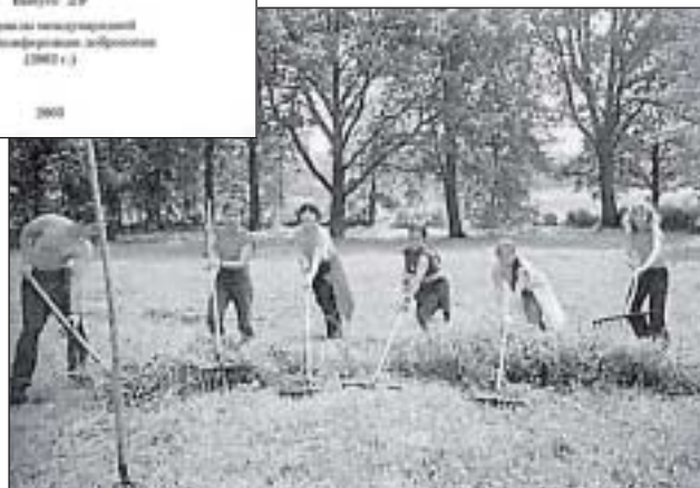
Добровольцы из отряда лицея № 1535 г. Москвы в Петровском (2003 г.)

степени возрастает роль как школьного учителя, так и музейного педагога, которые обеспечивают вхождение ребёнка в сложный и полифонический мир современной культуры.