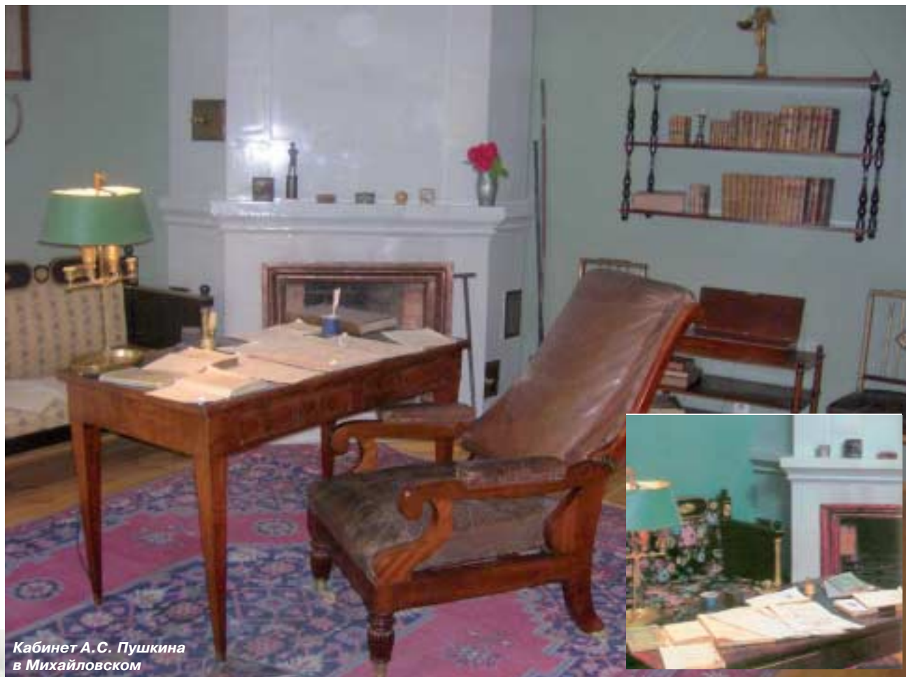
Кабинет А.С. Пушкина в Михайловском

Разнообразные способы решения задач способствуют активному включению музейно-образовательных программ в систему базового и дополнительного образования Пушкиногорских школ. Задача и смысл педагогической деятельности МОУ «Пушкиногорская средняя школа им. А.С. Пушкина» — сотрудничество учащихся и педагогов по освоению культурологических ценностей с Государственным музеем-заповедником А.С. Пушкина, что может рассматриваться как реализация позиций учителя и ученика