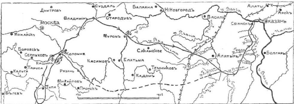
Отчетная карта похода Иоанна Грозного под Казань в 1552г.

16 июня 1552 года начало похода. Направление и от Мурома, и от Коломны на Свяжск. Но в первый же день получают сведение о движении крымцев. Царь немедленно сосредоточивается на участке Оки: Кашира—Коломна, с главными силами у последней, т. е. в общем там, где в 1380 году Дмитрий Донской. Здесь, среди всех направлений, обеспечив себя образцовой разведкой, Царь 20-го ждет дальнейшего. 21-го ему доносят, что крымский царевич у Тулы. Царь продолжает лично ждать и двигает к Туле только часть сил 23-го из-