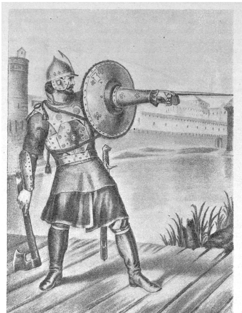
Русское вооружение с XIV до половины XVII в. — Ратник.

Поход к Казани удается. Он быстр, искусен, смел.