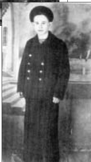
«С мечтой о море»