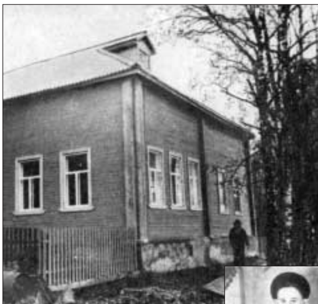
Детдом в селе Никольском

Этим стихотворением Рубцов бесповоротно завоевал доверие читателя. Мы забываем, что это просто «слова»: мы начинаем видеть и зеленый простор, и деревенскую школу, и купол полуразрушенной церквушки, и одновременно мы ощущаем, что пережил поэт.