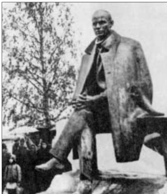
Памятник Рубцову в Тотме

Звучит песня на стихи Н. Рубцова «Букет».