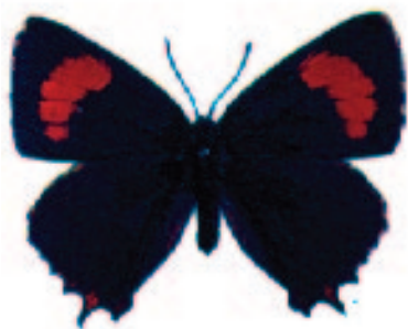
Зефир березовый, Thecla betulae — обидчица Набокова

символизировала звено в исторической связи всех живых существ. И даже растоптанная, она остается прекрасной, «отливающей зеленью, золотом и чернью».