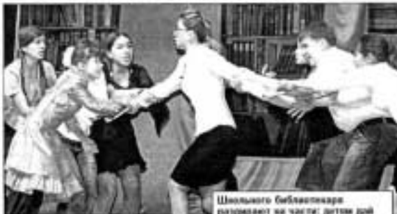
Школьного библиотекаря разбирают на части: детям для мамки, учителям педагогов, литературный праздник... Да еще директор скажет: «Подготовку собираем». Как мать?

Сейчас для учителей книга - источник информации, а не источник знаний. Подлинный интерес - только в рамках экзаменов. Все это происходит в Южной Корее, - пред-